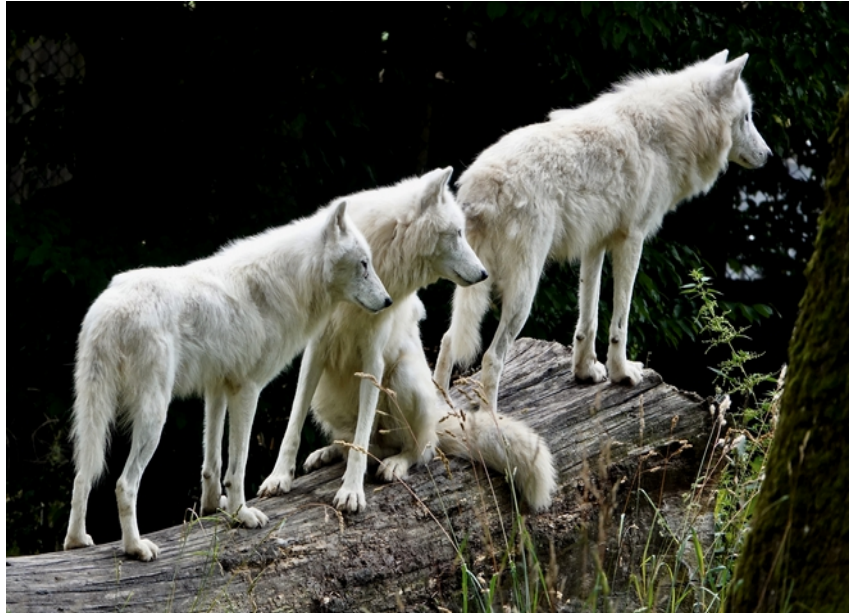
FAnh.19 Polarwolf (Parc Animalier de Sainte-Croix/F).

Polar-/Weißwolf Arctic wolf C. lupus arctos (eine von noch lebenden 5 US-Unterarten des Grauwolfs): Er ist der größte und kräftigste Wolf (bis 80 kg); nach dem Eisbären das größte Raubtier der Polarregion und lebt im hohen Norden AK-US sowie im Osten und Norden Grönlands überall dort, wo im Sommer das Eis taut und genügend Pflanzen wachsen, um seine Beutetiere, wie Karibu, Moschusochsen, Eisfuchse 1/83 , Schneehasen (- 80 km/h), Berglemminge und Vögel, zu ernähren. Mit seinem extra dichten Fell (bis 6.500 Haare/cm 2 ) trotzt das im Winter schneeweiße Tier in der nicht einmal von Eskimos bewohnten Regionen Temperaturen von bis zu -50 °C. (SWP/KRUSCHEL 18.1.22; 49 Wie verändert sich das Verhalten des Wildes?; DeWiSt , KAN@2014 ; NDR@2016 ; NDR@2018 .)