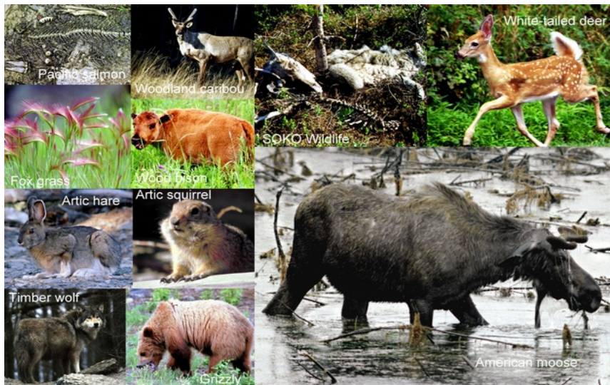
FAnh.13 Speisekarte „Grizzly u. Timberwolf“ DF Nova 12.4.21 : Fische (F: Rotlachs-Reste), Karibu/Waldren ZDF@2022 , Weißwedelhirsch (F: Kalb), Gräser, Waldbison (F: Kalb), Polarhase, Arktisches Ziesel (Körpertemperatur bis -3°C), ♂ Amerikanischer Elch. Zu „SOKO Wildlife“: Waldren-Kopf und zwei teils skelettierte Grau-Timberwölfe (Tanana Valley State Forest/AK-US) – vermutlich hatten die Wölfe das Karibu gerissen und wurden bei der Verteidigung ihrer Beute von einem Grizzly getötet. Siehe auch „Seeotter als Beutetier“ Spektrum 25.1.23 .

Box: Vergessen sie die TV-Bären: Dort treten fast ausschließlich Grizzlys auf. Und die haben mit ihren europ. Verwandten nur wenig gemein. Der heimische „Meister Petz“ ist nicht nur kleiner, sondern auch bedeutend weniger aggressiv! PS: In CDN und USA gilt: "A fed bear is a dead bear" (Ein gefütterter Bär ist ein † Bär)! ( 072, 332, provinz.bz.it ; i Denali N.P. ; „Gesetzeshüter auf Patrouille“ Kabel1 Doku ).