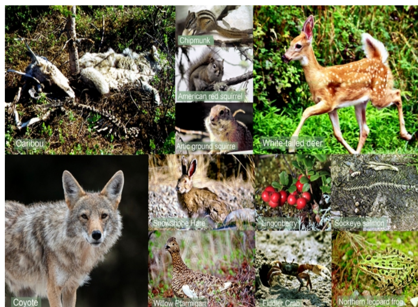
FAnh.22 Speisekarte „Coyote“ © HF, Collage: © Sonja Felgner: Caribou (F: Wald-Karibu - Aas [„SOKO Natur“: siehe F I/71!]), Streifen-, Amerikanisches Rothörnchen, Arktisches Ziesel, Weißwedelhirsch (F: Kalb), Polarhase, Früchte/Beeren (F: Preiselbeeren), Fische (F: Reste vom Rotlachs), Moorschneehuhn (F: ♀ Sommergefieder), Krebse (F: Winkerkrabbe), Amphibien (F: Leopard-Frosch). Kojote (Parc Animalier de Sainte-Croix/F - © Sonja Felgner).

Kojote Steckbrief Cojote Canis latrans Prärie- oder auch Steppenwolf (abgeleitet vom Aztekenwort „cojótł“ = Mischling): Er gehört zur Familie der Hunde Canidae und sieht einem kleinen Wolf ähnlich. Er bewohnt den nordamerik. Kontinent vom subpolaren Norden Kanadas und Alaskas über die gesamte USA und Mexiko bis nach Costa Rica und hat sich einer Vielzahl von Habitaten angepasst. Ursprünglich war das Verbreitungsgebiet auf die Prärieregionen und das Buschland im Westen und Mittleren Westen von USA begrenzt. Durch den Rückgang des Wolfsbestandes und Veränderungen des Lebensraums in Folge der sich ausbreitenden Besiedlung Nordamerikas hat er sich jedoch neuen Lebensraum erobern können; dabei hat er die gesamte östliche Hälfte während der letzten Jz. besiedelt. Er bildet größere Rudel und wird im Osten auch durchschnittlich größer als im Westen. Als anpassungsfähiger Kulturfolger 1 ist diese Art mittlerweile auch in Stadtgebieten anzutreffen, wo sie sich i.d.R. von menschlichen Abfällen ernähren. 1 Pflanzen- oder Tierart, die in der Nähe menschlicher Ansiedlungen günstige Lebensbedingungen für sich findet. In der Mythologie vieler Indianerstämme nimmt er eine zentrale Rolle ein. Er wird meist als listiger „Trickster“ dargestellt, der mit Hilfe von Tricks die Ordnung im „göttlichen“ Universum durcheinanderbringt ( Wiki ).