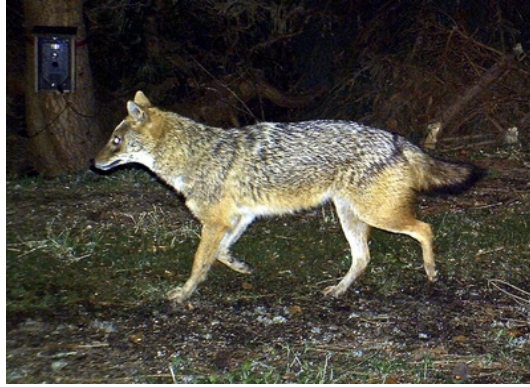
FAnh.54 Goldschakal Canis aureus Ff 26.4.12 © N.P.-Verw. Bayer. Wald; BUND; BR©2019. PS: 219 der insges. 235 registrierten und bestätigten Nachweise seit '21 im SW wurden über Ff gemacht (SWP/FVA 21.2.23).