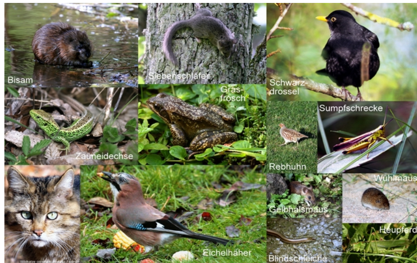
FAnh.32 Beutespektrum Wildkatze: Mäuse (15 - 20 St. täglich), Junghasen, Kaninchen A , Bisam, Eichhörnchen B , Siebenschläfer (weitere Kleinsäuger machen bis zu 80% den Nahrungsanteil aus), Vögel, Amphibien, Reptilien, Fische C , Insekten, kaum pflanzl. Nahrung, in Ausnahmen auch Aas D ; Wühlmäuse (Spitzmäuse E werden †, aber nicht gefressen!). ( wildkatze.info ; BUND 27.4.22 ; „Naturparadiese“ SWR@2013, NDR@2020 ).

zbox: ≈ 3.000 gesammelte Haarproben wurden bereits analysiert. Darüber gelang der Nachweis von 519 Expl. BfN 22.1.15 . Lt. Senckenberg-Institut sind sie in D weiter verbreitet als vermutet.* Das mit noch ≈ 170 km noch nicht lückenlose „Grüne Band“ (bislang knapp 1.400 km; allein in D beheimatet es ≈ 5.200 Tier-/Pflanzenarten; BUND 7.6.22 ) ist ein wichtiges Refugium für bedrohte Tiere u. Pflanzen (es kommen heute > 1.200 bedrohte Tier-/Pflanzenarten vor). Das Projekt "Lückenschluss Grünes Band" will den Biotopverbund in SA u. TH stärken. Auf Initiative D's soll das Grüne Band Europa als UNESCO WeltNatur- und Kulturerbe nominiert werden.** Sichtungen und Totfunde bitte melden: Tel. 0761-4018274! ( BUND 5.12.13/6/2015/26.4.21/21.3.22 ; MVI BW 31.7.15 ; WuH 22.6.16 ; BMUB 11/2016 + PM 282/2017 ). PS: 25 % der Wildkatzen kommen durch dokumentierte Pkw-Wildunfälle um – zumeist Juv. Anh.33 (Dunkelziffer?!). ( Charlotte Reutter „Wildkatzen droht besonders im Herbst der Tod an der Straße: ÖKOJAGD 4-2018 67 ; „20.000 Grüne KM“ 67 ). Siehe BUND-Tipp „Bitte nicht mitnehmen!“ 4.1./5.12.13/ 17.5.21/ Jahresbericht '19. i Schädlingsbekämpfer : 12 Mäuse pro Tag kann eine Katze fangen – wichtig auf dem Bauernhof..., Tierische Hilfe ZEIT 22.2.19; siehe auch oben: F „Beutespektrum Wildkatze“! Anm.: BUND Wildkatzenbüro BW : 015208794420, wildkatze.bawue@bund.net !