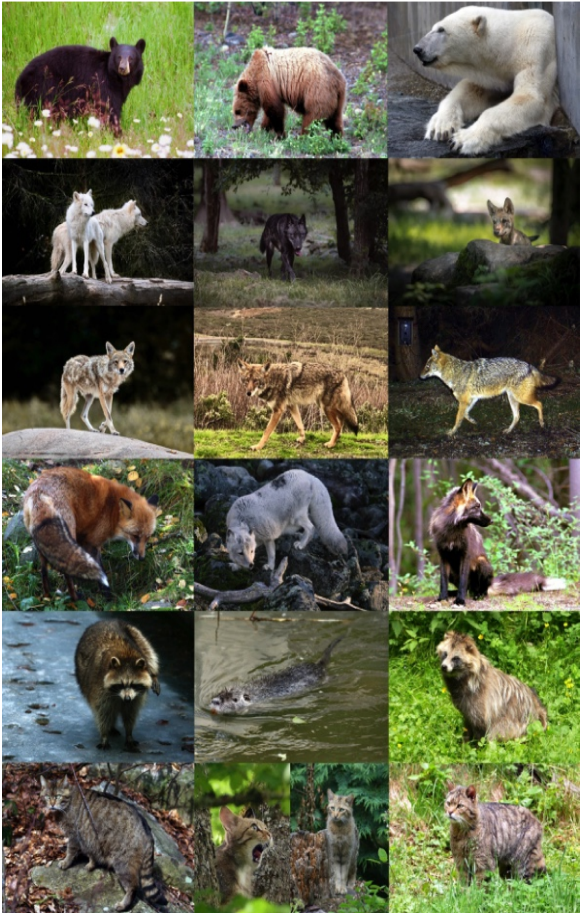
FAnh.61: American black -, Brown Bear, Eis-/Polarbär, Polar-/Weiß-, Timber-, Euras. -/Grauwolf-Welpen, Coyote-/Eastern), Euras. Goldschakal, Rot-, Polar-/Eisfuchs, Alaska Red Fox, Waschbär, Nutria, Marderhund, untere Reihe: Europ. Wildkatze.