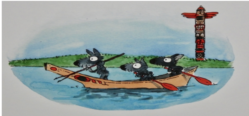
FAnh.07 „Der Mackenzie-Wolf lebt in Alaska u. West-CDN“ - 67 „Wer fürchtet sich vorm bösen Wolf“ [S.8] Heinz Grundel 2.

kontrollieren (von ursprünglich ≈ 20.000 auf 6.000 Expl.). Ihr Rückgang erklärt sich aber nicht allein durch die Zahl der Risse; offensichtlich wichen die Wapitis (bis 450 kg) nun teils auf andere Weidegebiete aus, um der Gefahr zu entkommen. So konnte sich der Bestand spezieller Pflanzen in der von Wapitis gemiedenen Gebieten erholen. Von der Rückkehr profitieren Grizzly (> 700 Expl.; seit 1975 verfünffacht), da Büsche mit nahrhaften Beeren, eine wichtige Ressource vor ihrer Winterruhe, sich wieder ausbreiteten. Da viele Wapitis den Wölfen zum Opfer fielen, starben weniger Wölfe während des Winters eines natürlichen †. Deswegen ging die Zahl der eingefrorenen Hirschkadaver, die den Bären als Mahlzeit zur Vfg. standen, rapide zurück. Beide waren nun gezwungen, verstärkt auf eine andere Nahrungsquelle auszuweichen: dem Bison 1 Bison bison Anh.08 . Dies zwang die Wölfe 2 dazu, in größeren Gruppen zu