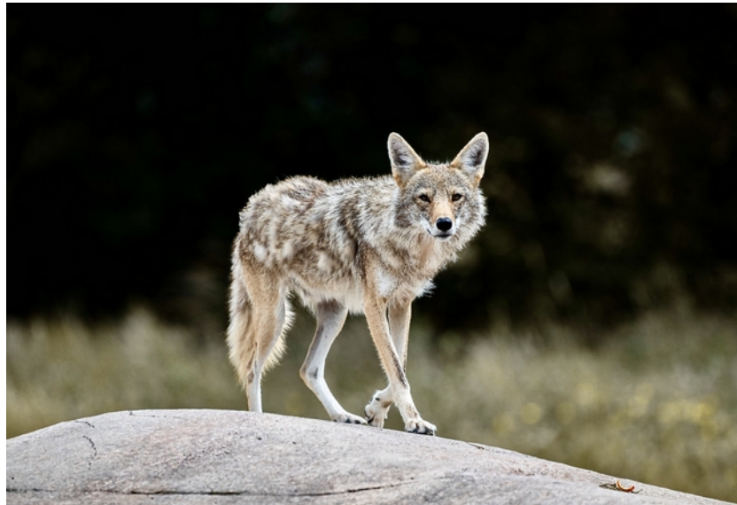
FAnh.21 Kojote (Parc Animalier de Sainte-Croix/F – © Sonja Felgner)

Kojote Steckbrief Cojote Canis latrans Prärie- oder auch Steppenwolf (abgeleitet vom Aztekenwort „cojótł“ = Mischling): Er gehört zur Familie der Hunde Canidae und sieht einem kleinen Wolf ähnlich. Er bewohnt den nordamerik. Kontinent vom subpolaren Norden Kanadas und Alaskas über die gesamte USA und Mexiko bis nach Costa Rica und hat sich einer Vielzahl von Habitaten angepasst. Ursprünglich war das Verbreitungsgebiet auf die Prärieregionen und das Buschland im Westen und Mittleren Westen von USA begrenzt. Durch den Rückgang des Wolfsbestandes und Veränderungen des Lebensraums in Folge der sich ausbreitenden Besiedlung Nordamerikas hat er sich jedoch neuen Lebensraum erobern können; dabei hat er die gesamte östliche Hälfte während der letzten Jz. besiedelt. Er bildet größere Rudel und wird im Osten auch durchschnittlich größer als im Westen. Als anpassungsfähiger Kulturfolger 1 ist diese Art mittlerweile auch in Stadtgebieten anzutreffen, wo sie sich i.d.R. von menschlichen Abfällen ernähren. 1 Pflanzen- oder Tierart, die in der Nähe menschlicher Ansiedlungen günstige Lebensbedingungen für sich findet. In der Mythologie vieler Indianerstämme nimmt er eine zentrale Rolle ein. Er wird meist als listiger „Trickster“ dargestellt, der mit Hilfe von Tricks die Ordnung im „göttlichen“ Universum durcheinanderbringt ( Wiki ).