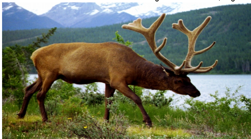
FAnh.09 Wapiti ♂ / Elk / Cervus canadensis - ( Steckbrief /Jasper N.P. Alberta/CDN UNESCO/IUCN-II) HF „Wild Animals of North America“ F-Serie und „Kanada - Alaska“ F-Serie ; WDR©2016 ; ZDF©2017 ; ARD©2021 ; WDR©2021 ; „Yellowstone – Das Geheimnis der Wölfe“ facebook .

kontrollieren (von ursprünglich ≈ 20.000 auf 6.000 Expl.). Ihr Rückgang erklärt sich aber nicht allein durch die Zahl der Risse; offensichtlich wichen die Wapitis (bis 450 kg) nun teils auf andere Weidegebiete aus, um der Gefahr zu entkommen. So konnte sich der Bestand spezieller Pflanzen in der von Wapitis gemiedenen Gebieten erholen. Von der Rückkehr profitieren Grizzly (> 700 Expl.; seit 1975 verfünffacht), da Büsche mit nahrhaften Beeren, eine wichtige Ressource vor ihrer Winterruhe, sich wieder ausbreiteten. Da viele Wapitis den Wölfen zum Opfer fielen, starben weniger Wölfe während des Winters eines natürlichen †. Deswegen ging die Zahl der eingefrorenen Hirschkadaver, die den Bären als Mahlzeit zur Vfg. standen, rapide zurück. Beide waren nun gezwungen, verstärkt auf eine andere Nahrungsquelle auszuweichen: dem Bison 1 Bison bison Anh.08 . Dies zwang die Wölfe 2 dazu, in größeren Gruppen zu