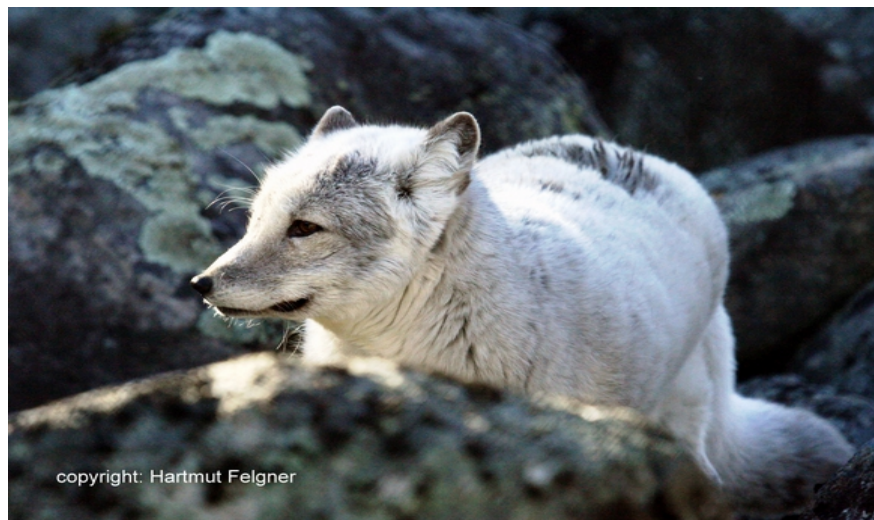
FAnh.52 Polarfuchs (F Varangerfjord/N + Anh.53 ff. Lebensraum – s. HF F-Serie ) sieht dem Rotfuchs ähnlich – sie sind ja auch verwandt; er ist jedoch kleiner u. leichter, hat kleinere Ohren u. eine kürzere Schnauze.

Polar-/Eisfuchs Steckbrief Vulpus lagopus – das bedeutet übersetzt "hasenfüßiger Fuchs" – die Pfoten sind wie die des Polarhasen mit Fell besetzt. Einzige Wildhunde, die ihre Fellfarbe der Jahreszeit anpassen. Im Winter tragen sie ein schneeweißes Winterfell (Weißfuchs – oder es färbt sich grau: Blaufuchs). Es schützt sie vor der Kälte im hohen Norden von Europa, RUS, CND KAN@2017 , AK-US und Grönland, v.a. in den Tundren; er ist aber auch auf dem Packeis der Arktis anzutreffen. Das Sommerfell ist mehr oder minder braun. Sie besitzen einen exzellenten Geruchssinn, der es erlaubt, Beutetiere oder Aas über weite Strecken u. durch dickes Eis aufzuspüren. Sie fressen so ziemlich alles, was sie zerbeißen können: v.a. Lemminge u.a. Nager (außer auf Spitzbergen, wo sie nicht leben); ansonsten Vögel, Eier, Küken, Weichtiere, Kadaver und Fischreste. Natürliche Feinde sind der Polarwolf 174 und gelegentlich der Eisbär 172 , zu dem er Abstand hält. ( GEOlino/Tierlexikon , Biologieschule ; WDR@2018 ; ORF@2018 ; HF , „FIN – Nordskandinavien“ + F-Serie und „Wild Animals of North America“ F-Serie ).