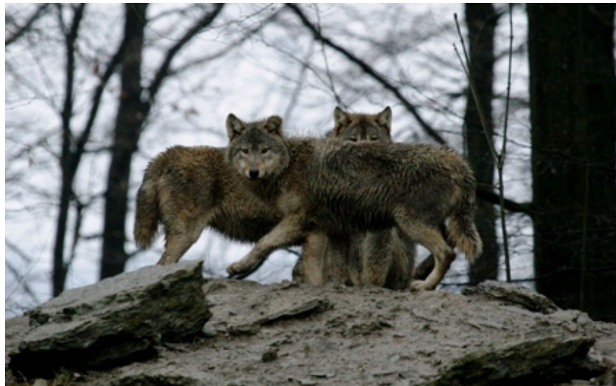
FAnh.18 Timberwolf (Steckbrief / WP Bad Mergentheim; schwarze Farbvariante siehe F I/74)

Timberwolf Eastern Wolf Canis lupus lycaon : F I/79 Untersuchungen im N.P. Isle Royale (535 km 2 ) im Oberen See/ Michigan/USA, wo seit 55 Jahren das Verhältnis zw. Elchen und Wölfen wissenschaftlich begleitet wird, zeigen, dass es den Wölfen in dieser Zeit nicht möglich war, ihre Beutetiere auszurotten oder auch nur drastisch zu reduzieren, obwohl diese auf der verhältnismäßig kleinen Insel nicht ausweichen konnten. Insges. beherbergt Europa jedoch über doppelt so viele Wölfe wie in den USA (≈ 5.500 Expl. ohne AK-US), ist dabei nur rd. ½ so groß und mehr als doppelt so dicht besiedelt Nach Welt 11.12.20. (450; Wolf Magazin 2/2014; DiePresse 14.7.16; YouTube; 8 Hunde/ zbox, 59 Verhalten gegenüber Wölfen, 67 Of Wolves and Men; Katharin Pieta „Rückkehr der Wölfe“ wildlife observer 1-2/1999; Majestic Animals 3.9.19). PS: Wolfspopul. in CDN soll um 80 % gesenkt werden WuH 19.3.20; „Streit um Wolfsmanagement in USA - 216 † Wölfe in 60 Std.“ Natürlich Jagd 4.3.21; Nau.ch 11.; „zu USA“ FAZ 12.2.22. Siehe „Wolfsmumie aus dem Permafrost...“ GMX 21.12.20; „Letzte Eiszeit“ Dlf Nova 12.4.21!