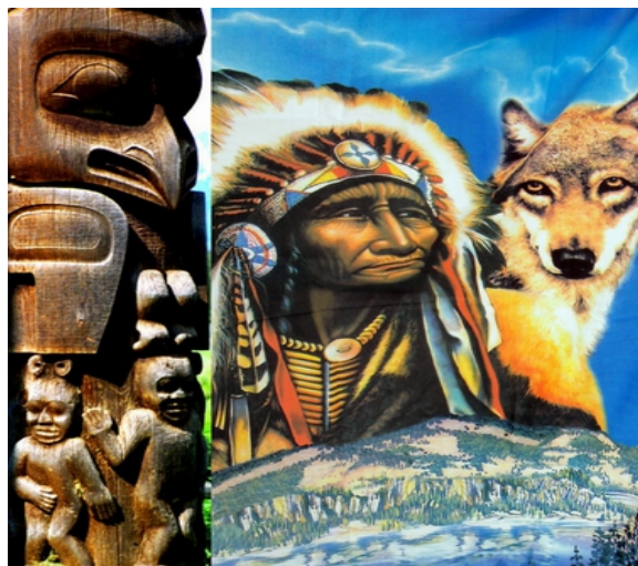
FAnh.14 Totem Gitksan-Stamm ('Ksan Indian Village/B.C.) u. Kontinent Warszawa/PL (Wielu Kultur '14) – Totem „Der Luchs“ steht für das Geheimwissen der Natur und für die vergessenen Weisheiten. (Tiertotems der First Nations waokiye.de ; Simone Müller „Totempfähle“ GEOlino extra Nr. 38/2013 ).

Box: Vergessen sie die TV-Bären: Dort treten fast ausschließlich Grizzlys auf. Und die haben mit ihren europ. Verwandten nur wenig gemein. Der heimische „Meister Petz“ ist nicht nur kleiner, sondern auch bedeutend weniger aggressiv! PS: In CDN und USA gilt: "A fed bear is a dead bear" (Ein gefütterter Bär ist ein † Bär)! ( 072, 332, provinz.bz.it ; i Denali N.P. ; „Gesetzeshüter auf Patrouille“ Kabel1 Doku ).