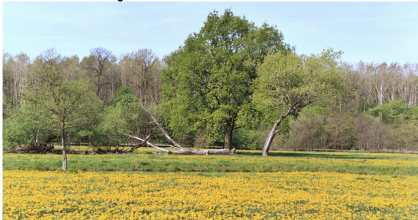
FAnh.40 Lebensraum NP Schlaubetal/BB - Der Marderhund bevorzugt mosaikartige Landschaften mit Feldern und kleinräumigen Wäldern; Schlafhöhlen werden Anh.41+42 von Zeit zur Zeit gewechselt. ( www.wildtier-kaster.uni-kiel.de ).

Ähnlich wie der Waschbär bevorzugt er Wassernähe, aber anders als dieser klettert er nicht, ausgenommen im Buschwerk! Siedlungen und deckungsfreie Flächen werden weitestgehend gemieden. Zu seinen natürlichen Feinden zählen Bär, Vielfraß, Wolf, Luchs und Uhu 1 (für Juv.) Anh.43+44 . Verwechslungsgefahr: Während der Marderhund sich als „Zehenspitzen-gänger“ wie ein Hund mit geradem Rücken und leicht federnden Schritten bewegt, kommt der Waschbär als „Sohलगänger“ mit schwerfällig wirkendem Gang u. einem Buckel daher ( LAZ BW ). Als Parasit befällt ihn der Fuchsbandwurm. Wie andere Neozoen ist der Marderhund lt.