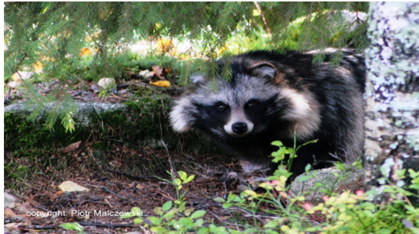
FAnh.39 Marderhund Nyctereutes procyonoides ( Steckbrief/VO [EU] 1143/2014 Neozoen/JWMG[BW] Oulangan kansallispuisto/FIN). In D leben > 100.000 Expl. (schon in den 1970er Jahren. im NP Schönbusch nachgewiesen); nur kennt sie kaum einer, denn sie sind v.a. „nachtaktiv“ DF Nova 5.8.15 ; BR02019 : Jagdstrecke '21/'22 in D 27.381 St.