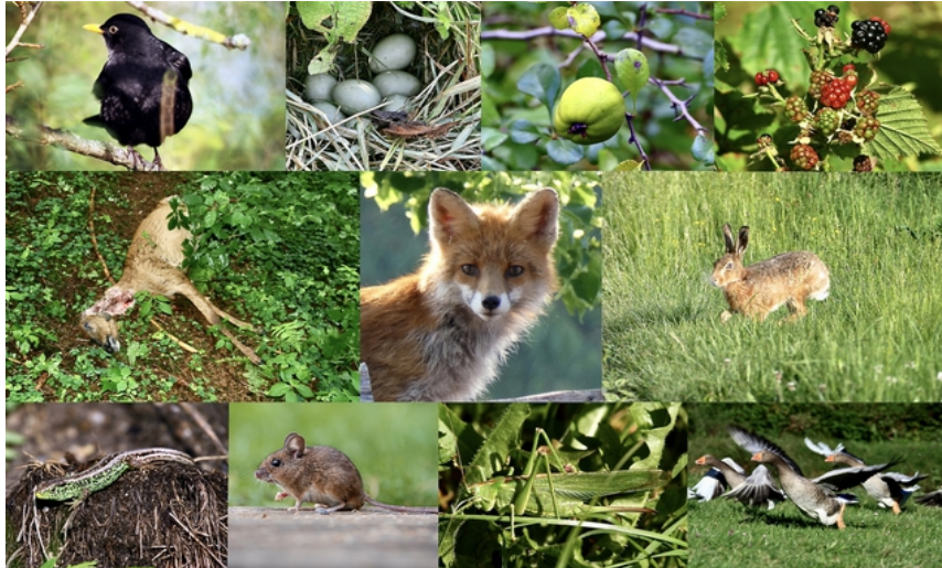
FAnh.51 Speisekarte „Rotfuchs“ © HF: Vögel (F: Schwarzdrossel), Eier (F: Stockentengelege), Früchte (F: Holz-/Wildapfel), Beeren (F: Brom-), Aas (F: Reh/Riss... spricht für den Fuchs als "Nachnutzer" – vermutlich aber Hunderiss), kleinere Wildtiere (F: Feldhase), Amphibien (F: Zauneidechse ♂), Mäuse (F: Gelbhalsmaus [≈ 30 Kilo Mäuse jährlich DeWiSt 20.1.16] © Hannah Felgner), Insekten (F: Grünes Heupferd ♀), wo möglich Federvieh (F: Russische Gänse – Schäferei Hertler, Deggingen Anh.51A ). Collage © Sonja Felgner. >>> Video!

Polar-/Eisfuchs Steckbrief Vulpus lagopus – das bedeutet übersetzt "hasenfüßiger Fuchs" – die Pfoten sind wie die des Polarhasen mit Fell besetzt. Einzige Wildhunde, die ihre Fellfarbe der Jahreszeit anpassen. Im Winter tragen sie ein schneeweißes Winterfell (Weißfuchs – oder es färbt sich grau: Blaufuchs). Es schützt sie vor der Kälte im hohen Norden von Europa, RUS, CND KAN@2017 , AK-US und Grönland, v.a. in den Tundren; er ist aber auch auf dem Packeis der Arktis anzutreffen. Das Sommerfell ist mehr oder minder braun. Sie besitzen einen exzellenten Geruchssinn, der es erlaubt, Beutetiere oder Aas über weite Strecken u. durch dickes Eis aufzuspüren. Sie fressen so ziemlich alles, was sie zerbeißen können: v.a. Lemminge u.a. Nager (außer auf Spitzbergen, wo sie nicht leben); ansonsten Vögel, Eier, Küken, Weichtiere, Kadaver und Fischreste. Natürliche Feinde sind der Polarwolf 174 und gelegentlich der Eisbär 172 , zu dem er Abstand hält. ( GEOlino/Tierlexikon , Biologieschule ; WDR@2018 ; ORF@2018 ; HF , „FIN – Nordskandinavien“ + F-Serie und „Wild Animals of North America“ F-Serie ).