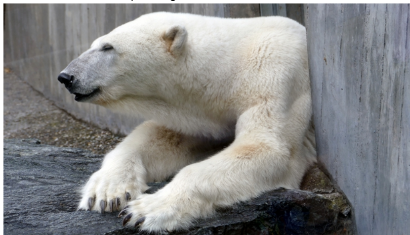
FAnh.17 Eisbär (Steckbrief/CITES-II/ ArtSchVO-B/IUCN-VU – WILHELMA Stuttgart). PS: Sein Geruchssinn ist 100 Mal besser als die der übrigen Bärenarten 3sat 2.2.22!

Eis-/Polarbär Icebaer Ursus maritimus F 1/78: Lebt in den nördlichen Polarregionen, ist eng mit dem Braunbären verwandt u. vor dem Kamtschatkabär 1 Kamtschatka U. arctos beringianus u. Kodiakbär 2 Kodiak U. a. middendorffi ZDF©2022 größtes Landraubtier der Erde. Hauptnahrung sind Robben; er frisst aber auch Karibus, Moschusochsen **, Vögel und Eier, Krebstiere, Wal-Kadaver, Walrosse, andere Eisbären, Pflanzen 3 . Achtung: Sie sehen in uns Menschen eine potenzielle Beute! Der Lebensraum schrumpft wegen der Klimaerwärmung stetig und ihm das Eis so schnell unter den Tatzen weg, dass ihm keine Zeit mehr bleibt, sich anzupassen. Auch kreuzen sich die Wege von Eis- und Braunbären immer öfter und es kommt zu Hybridbären *. Mit ≈ 20.000 Expl. weltweit, davon allein ≈ 3.500 auf Spitzbergen/N, ist er vom Aussterben bedroht. ( 399 ; Wiki; GEOlino 1/2007 +